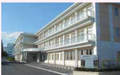
社会福祉法人 学而会 特別養護老人ホーム サンシャインプラザ