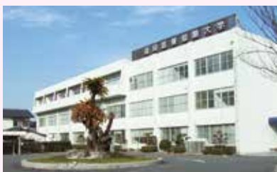
福岡医療短期大学