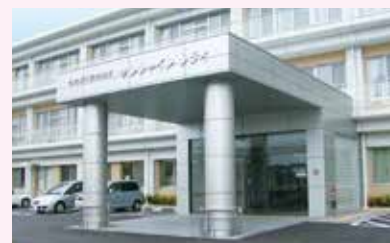
介護老人保健施設 サンシャインシティ