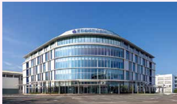
福岡歯科大学医科歯科総合病院