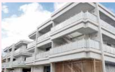
社会福祉法人 学而会 特別養護老人ホーム サンシャインセンター